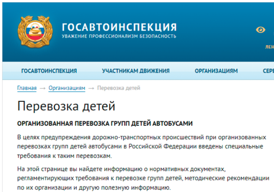
Рисунок 2. Сайт Госавтоинспекции для подачи уведомления

На данном сайте можно заполнить уведомление. Для подачи уведомления об организованной перевозке детей автобусами необходимо использовать специальный сервис данного сайта: https://гибдд.рф/transportation/applicant/ (рис. 3).