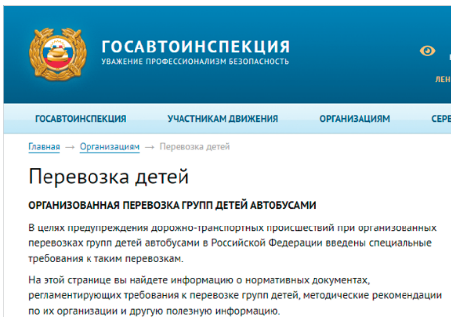
Рисунок 2. Сайт Госавтоинспекции для подачи уведомления

На данном сайте можно заполнить уведомление. Для подачи уведомления об организованной перевозке детей автобусами необходимо использовать специальный сервис данного сайта: https://гибдд.рф/transportation/applicant/ (рис. 3).