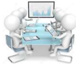
участие в вебинарах, семинарах